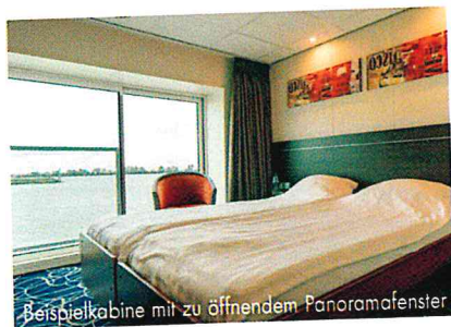
Beispielkabine mit zu öffnendem Panoramafenster