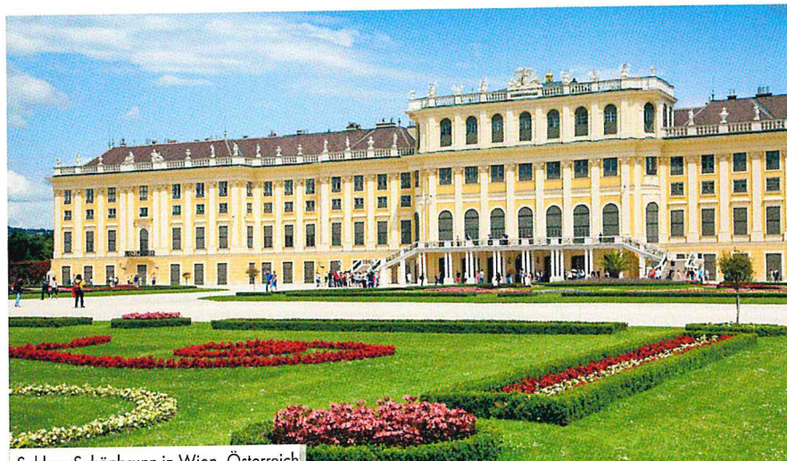
Schloss Schönbrunn in Wien, Österreich