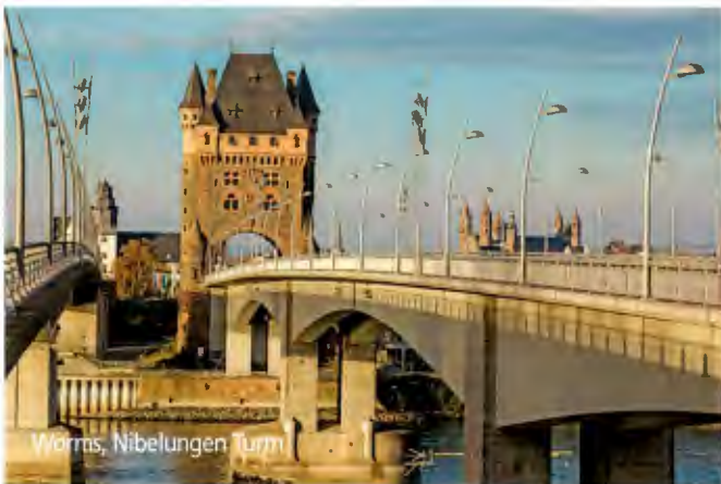
Worms, Nibelungen Turm

Diese Rheinflussfahrt auf dem größten Fluss Deutschlands ist eine Reise wert. Freuen Sie sich darauf an Bord verwöhnt zu werden und interessante Landschaften zu genießen. Probieren Sie den Rheingauer Riesling bei einem Dämmerchoppen in der Rüdeshheimer Drosselgasse. Heidelberg am Neckar mit seinem berühmten Schloss wartet nur darauf auf einem Ausflug von Ihnen entdeckt zu werden. Das Münster in Straßburg zeigt architektonische Meisterleistungen aus vergangenen Jahrhunderten. Der Aufenthalt kann nicht lang genug sein, bevor Sie durch den Breisgau nach Basel gelangen. Die Stadt bietet mit ihrem schönen historischen Ortskern, dem Rhein sowie zahlreichen Museen ein vielfältiges Besichtigungsprogramm. Eine Elsassrundfahrt mit Colmar ist ein Muss sowie Spaziergänge durch die aus Römerzeiten besiedelte Stadt Worms. Die Landeshauptstadt Mainz rundet Ihre Reise zu den Schätzen des Rheins ab.